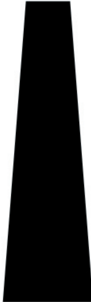
LA Revue montée de pavu.com